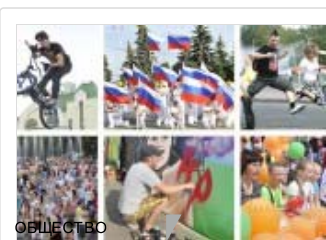
Как и где провести выходные в Липецке