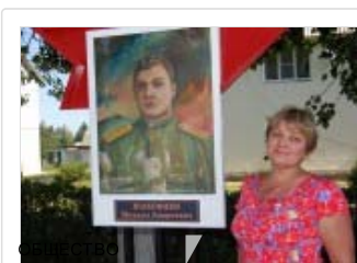
На становлянкой Аплее Славы увековечено имя десятого Героя