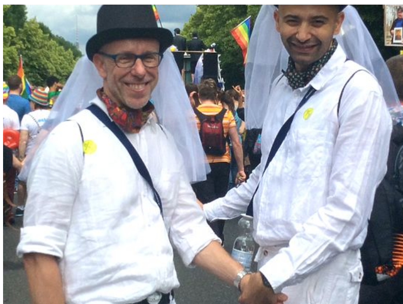
На улицах немецких городов гомосексуалы чувствуют себя вольготно.