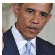
Премьер Малайзии одной фразой поставил на место Барака Обаму