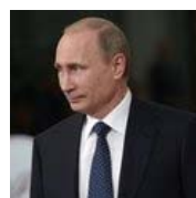
Сразу 3 страны поддержали Россию наперекор Брюсселю