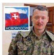
Война проиграна: Стрелков приказал сворачивать проект Новороссия