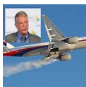
Пассажиры "Боинга-777" погибли не в самолете: пилот сказал правду ...