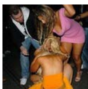
Массовая драка в Турции русских и украинцев. Жестокость поражает