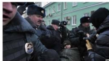
The bill triggered protests in Moscow and Voronezh

By Paul Henley BBC World Service, Voronezh