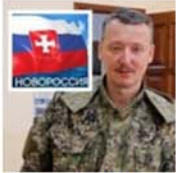
Война проиграна: Стрелков приказал сворачивать проект Новороссия