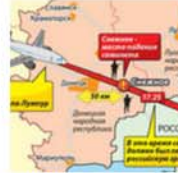
Катастрофа "Боинга" под Донецком - чистая провокация