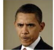
Малайзия сурово "поставила на место" президента США