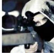
В Украине убитая известная женщина-снайпер (видео)