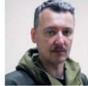
Новороссии больше не будет: Гиркин поднимает белый флаг