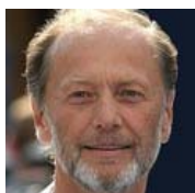
Слова Задорнова о сбитом Боинге: смело и ДЕРЗКО