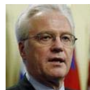
Вышедший из себя Чуркин устроил РАЗНОС всем подряд