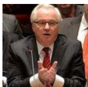
Чуркин разнес все страны "в пух и прах": слова не подобрал