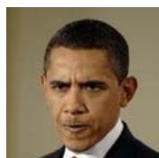
Малайзия сурово "поставила на место" президента США