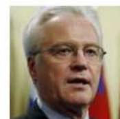
Вышедший из себя Чуркин устроил РАЗНОС всем подряд