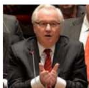
Чуркин разнес все страны "в пух и прах": слова не подобрал