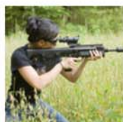
Наконец-то ополченцы "ухлопали" женщину-снайпер а из Польши. ...