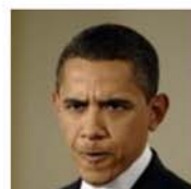
Малайзия сурово "поставила на место" президента США