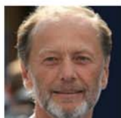
Слова Задорнова о сбитем Боинге: смело и ДЕРЗКО