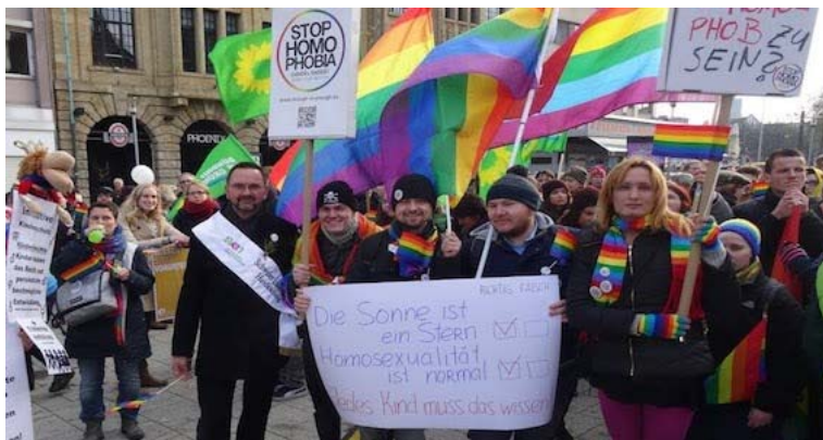
Российские ЛГБТ-активисты на акции в Ганновере 22 ноября 2014 года.

Власти Нижней Саксонии встали на сторону сексменьшинств, вывесив в месте проведения мероприятий радужные гей-флаги