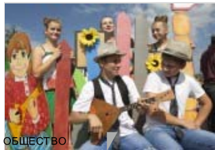
ОБЩЕСТВО Данковчане предлагают провести в Липецкой области фестиваль каравая