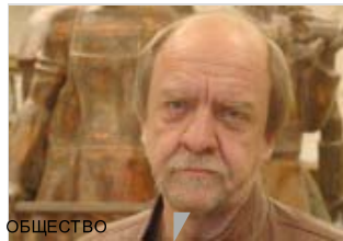
ОБЩЕСТВО Скульптор Вагнер станет богаче почти на четыре миллиона рублей