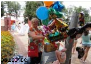
ОБЩЕСТВО Лебедянь: фонтан в реке, ярмарка, лошади и лебеди (фото)